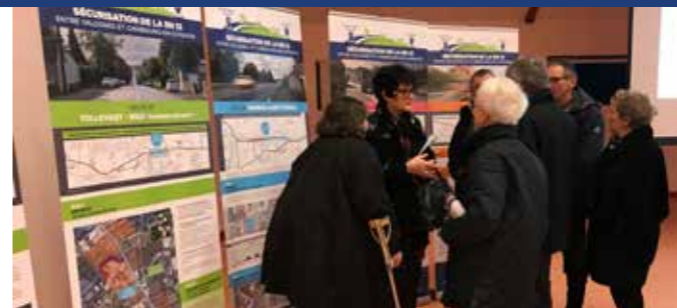
Mise à disposition du public de panneaux d'information à l'occasion d'une réunion publique