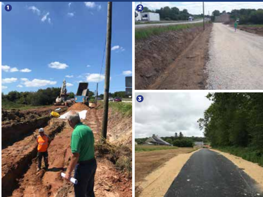
De gauche à droite et haut en bas

1 Travaux en cours sur le secteur de Saint Joseph. 2 Saint Joseph : travaux de desserte d'une habitation. 3 Pont d'Aumaille : desserte de deux habitations