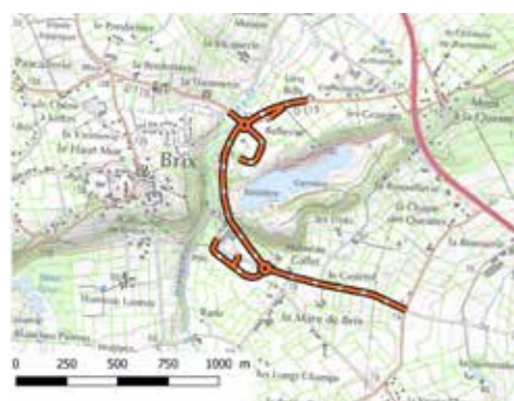
Contournement carrière de Brix

Les riverains et les usagers seront informés de l'évolution de cette programmation au fur et à mesure de son élaboration ●