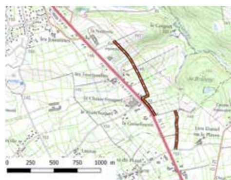
Voie de desserte Tourterelles Est